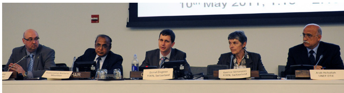
Panel des intervenants de l'événement parallèle sur les APD organisé à la CDD-19, mai 2011 - New York, Etats-Unis

Division Technologie, Industrie et Economie Service Consommation et Production Durables 15, rue de Milan 75441 Paris Cedex 09 France