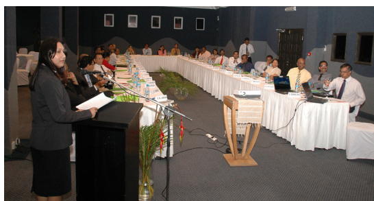
Atelier pour le développement d'une politique d'achat public durable à l'île Maurice - Novembre 2010

Lorsqu'il est admis que les conditions préalables sont remplies, le PNUE et le pays candidat signent un accord définissant leurs obligations mutuelles en matière de mise en œuvre du projet, de mobilisation de ressources et de mise à disposition des compétences internationales ainsi que des outils d'APD.