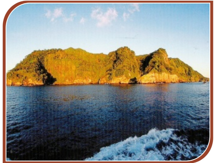
Le parc national de l'île Cocos au Costa Rica, seule île du Pacifique Est tropical pourvue d'une forêt humide tropicale, a été inscrit sur la liste du patrimoine mondial en 1997.

Le SICA évalue le niveau de capacités locales et nationales disponibles pour promouvoir le tourisme durable sur les sites du patrimoine naturel et culturel, ainsi que les réponses aux besoins en capacités qui ont été déterminés. Il identifie également les principales parties prenantes du secteur qui doivent être formées (par exemple, associations de guides touristiques, offices de tourisme, gestionnaires de parcs, organisations du tourisme, etc.) et impliquées dans le projet.