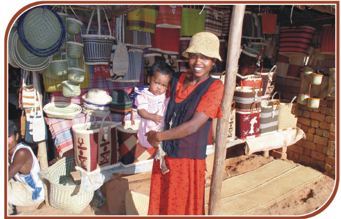
Le tourisme peut aider à préserver la biodiversité et être bénéfique aux économies locales.

Le tourisme est un des secteurs économiques les plus dynamiques dans de nombreux pays en développement, pays qui accueillent une part croissante du marché du tourisme international - 40 % des arrivées internationales actuellement contre 34 % en 2000 (cf. tableau ci-dessous). Le tourisme génère des emplois et des opportunités d'affaires pour les populations d'accueil et aide à réduire ou éliminer la pauvreté. Il joue désormais un rôle majeur dans l'économie de nombreux états insulaires, en particulier aux Caraïbes, en Méditerranée, en Afrique de l'Est et dans le Pacifique. En 2004, le tourisme et les voyages ont représenté 14,8 % du produit intérieur brut (PIB) des Caraïbes et 2,4 millions d'emplois, soit 15,5 % de l'emploi total. Chiffres qui devraient progresser dans les dix années à venir. De nombreux états insulaires, dont les Seychelles, ont enregistré une hausse significative de leur taux de développement grâce au tourisme.